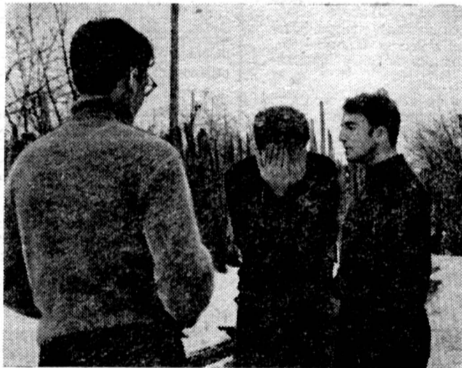
И на улице можно репетировать.

...После концерта разместились на ночлег. Первый день нашего похода окончен. У каждого этот день вызвал массу чувств и мыслей: наши вожак подводит итоги, строят планы на ближайший день. Хочется, чтобы последующие дни прошли отлично, концерты стали бы значительно лучше, чтобы слушатели нас понимали, а мы были бы удовлетворены своей работой. Ну что ж, лиха беда начало!