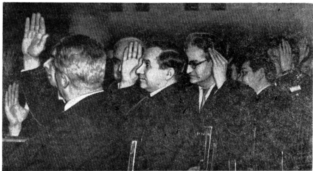
На снимке: участники собрания принимают социалистические обязательства.