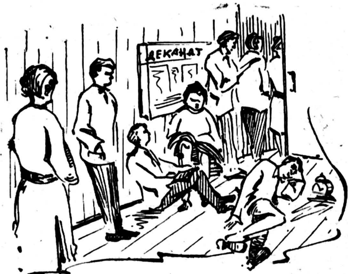
У ДВЕРЕЙ ДЕКАНАТА.

Нельзя ли упростить порядок решения «дел о пересдаче», чтобы у дверей деканата не наблюдалось картин, подобных изображенной ниже?