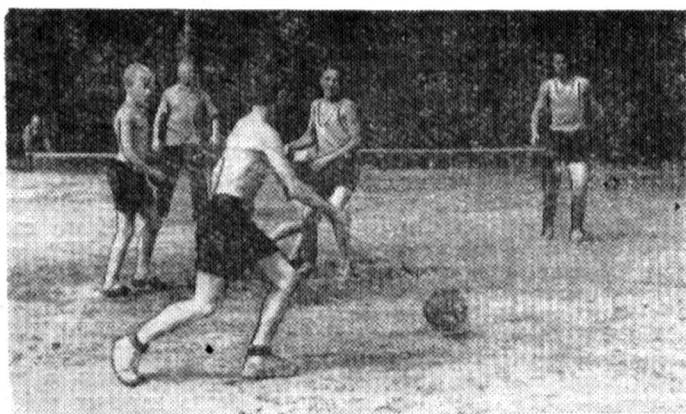
В укромном уголке уединились юные любители шахмат. На футбольном поле — пионерские команды (слева).

Следующий номер газеты выйдет 1 сентября 1961 года.