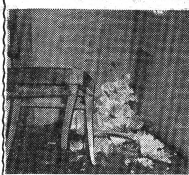
Фото без комментариев. На четвертом этаже...

Почему-то дипломанты считают особым шиком не только на-