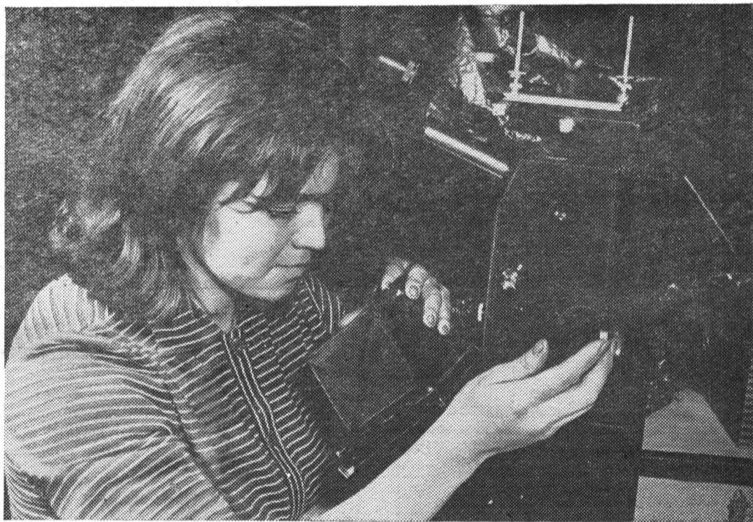
Оживленно в лабораториях и кабинетах института. Овладевая практическими навыками, будущие инженеры закрепляют свои теоретические познания.

Конечно, все бы было в порядке, не будь у студента иных интересов. Но тут-то и выясняется, что у него есть даже (!) культурные запросы: кино, театр, концерты, не запланированное программой посещение лекториев, увлеченность «домашней» радиотехникой и тому подобное. Где же выход? Говоря словами математика, задача неразрешима, ибо в конечном счете представляет один из вариантов задачи о «квадратуре круга», причем порочного круга. Может быть, действительно есть смысл сократить учебные программы, убрать из них кое-что, не дающее пользы студенту, как будущему творчески мыслящему инже-