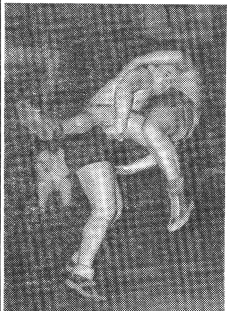
На снимках: сверху — парад участников; внизу — момент схватки.