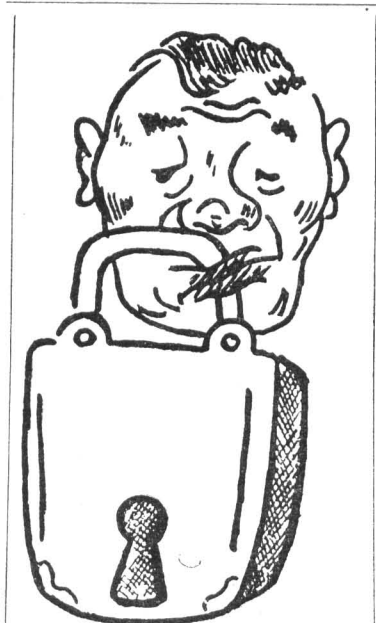
Ни ответа, ни приветия, Убегают дни, часы... Ждет молчаливых газета — Все четыре полосы.

Пусть некоторое из того, что говорилось в заметках, и невозможно по ряду причин сразу же принять к действию, однако получить ответ авторы писем, не говоря уже о всей массе чита-