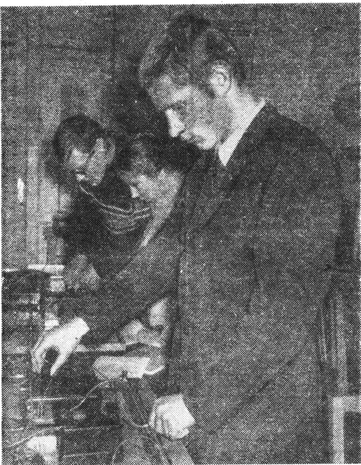
Лабораторные занятия — одна из наиболее эффективных форм учебного процесса. НА СНИМКЕ: второкурсники оптического факультета в лаборатории кафедры физики.