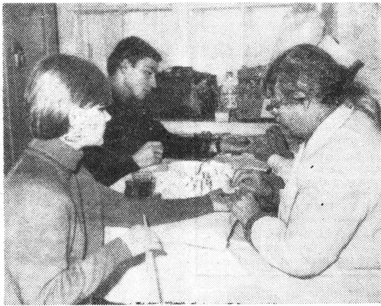
Широкий отклик у студентов и сотрудников института нашел призыв институтской ячейки РОКК о безвозмездной сдаче крови. На временный донорский пункт явилось желающих даже больше, чем были в состоянии принять медицинские работники.