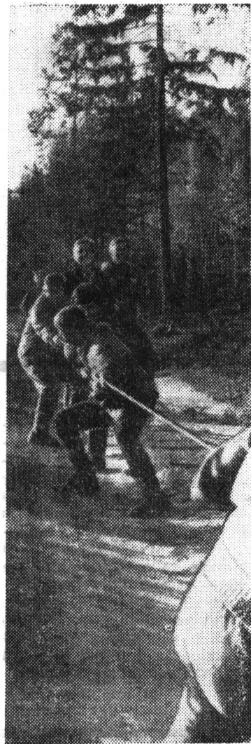
На слете туристов ЛИТМО. Традиционное состязание — перетягивание каната.