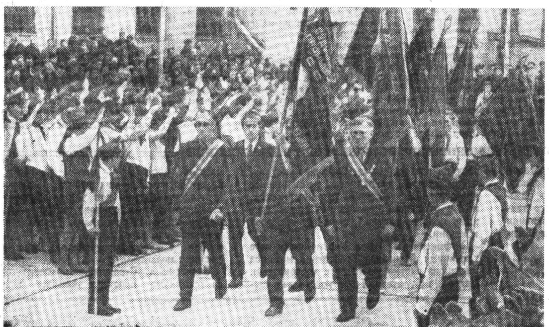
Традиционная пионерская линейка на Адмиралтейском заводе. Гости из подшефных школ у монумента Славы.

Воспитать настоящих людей будущего можно лишь в том случае, если они с первых шагов своей сознательной деятельности становятся не просто созерцателями труда взрослых, но и его