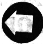
Сессия набирает темпы...