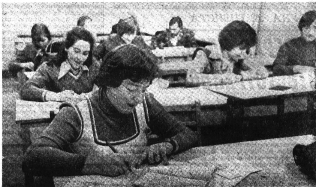
Четверкурсники сдают зачет по курсу политической экономии.

заведующий партийным отделом редколлегии