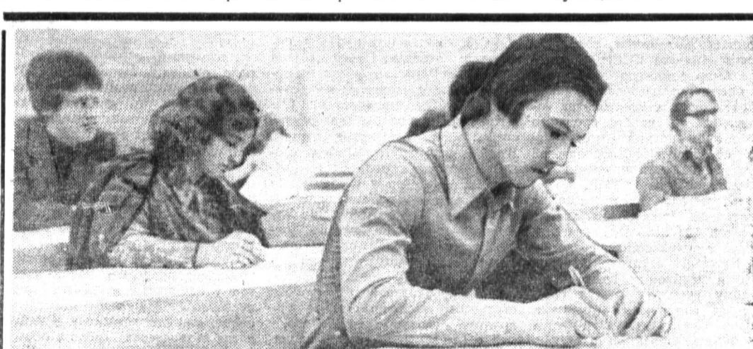
Студенты 555-й группы на экзамене по применению ЭВМ в конструировании и производстве электронно-вычислительной аппаратуры.