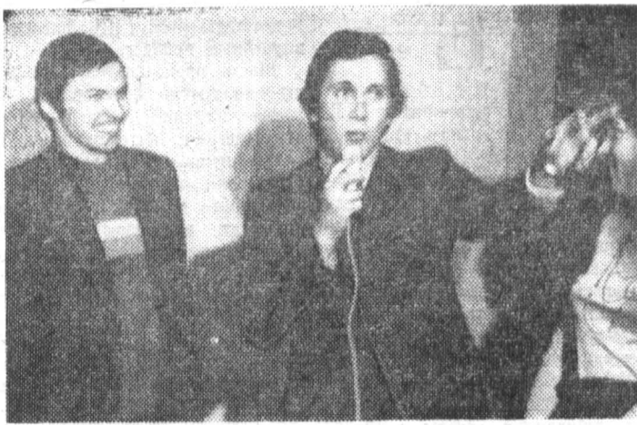
Оживленно и весело проходят всегда заседания студенческого клуба «Теплофизик».