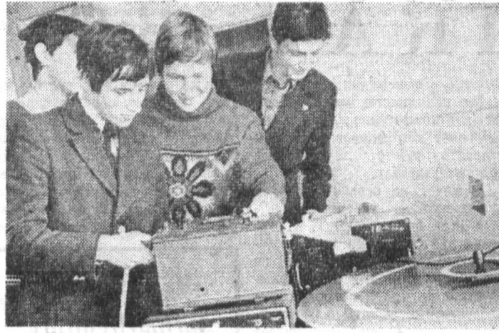
Традиционные «Дни открытых дверей», проводимые в институте весной, вызывают большой интерес школьников города.