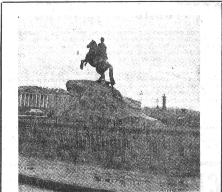
Наш город. На площади Декабристов.

С. ПЕТРАЧКОВА, преподаватель кафедры философии и научного коммунизма