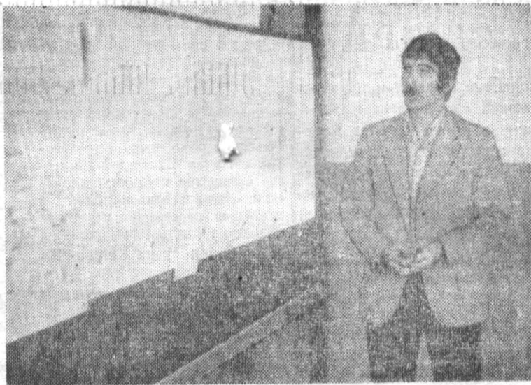
Отрадно, что студенческие работы, нашедшие отражение в докладах, как правило, имеют большое практическое значение. Это прогнозирование процесса типа качки. Проблемам роботостроения был посвящен коллективный доклад студентов 545-й группы На-

Студенческая научная конференция на кафедре автоматики и телемеханики.