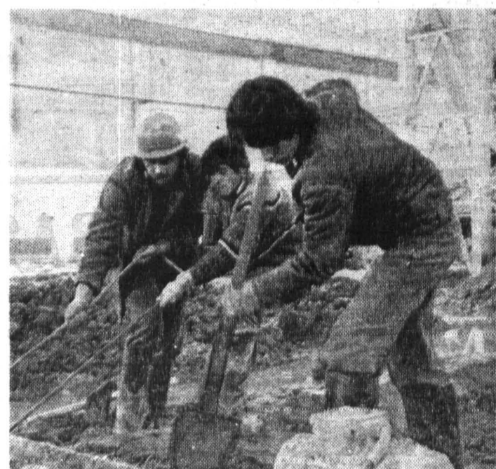
Бойцы отряда «Галера» бетонируют пол в строящемся цехе.