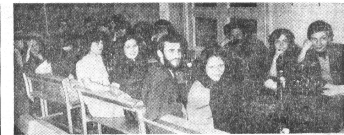
На дружеской встрече в студенческом клубе «Спектр».

Вскоре после опубликования первой работы Фридмана появилась заметка Эйнштейна. Эйнштейн писал, что он нашел ошибку в вы-