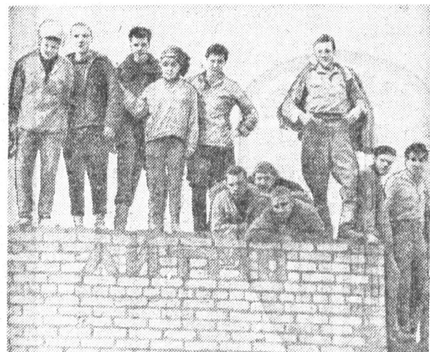
Будущим археологам не придется ломать голову, когда они копают эту стену.