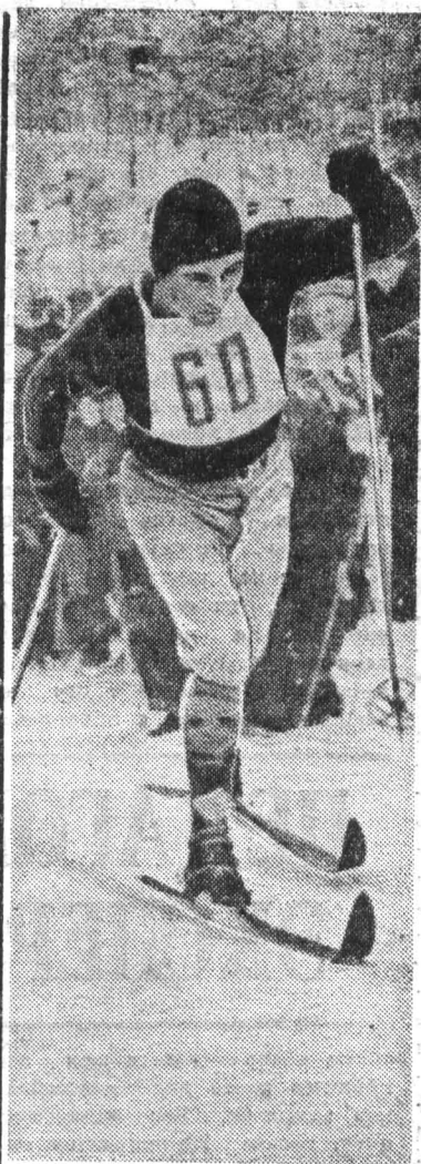
Зима — пора спортивных состязаний. На лыжне.

Е. КОМПАНЕЕЦ, научный сотрудник Государственного музея Великой Октябрьской социалистической революции