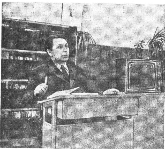
Занятия проводит заведующий кафедрой политэкономии доцент