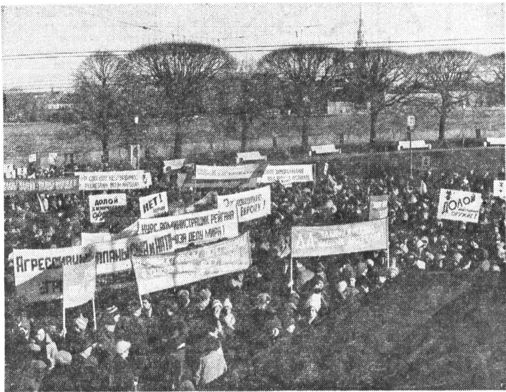
Ленинградские студенты на общегородской манифестации в защиту мира.