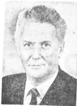
Ю. Ф. СОЛОВЬЕВ, кандидат в члены По- литбюро ЦК КПСС