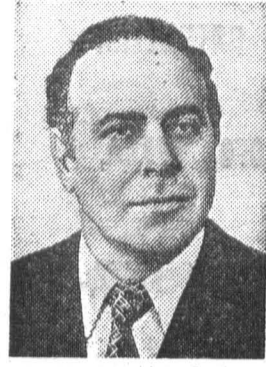
Г. А. АЛИЕВ, член Политбюро ЦК КПСС