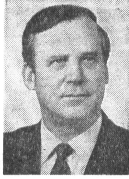
Н. И. РЫЖКОВ, член Политбюро ЦК КПСС