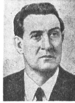
В. И. ДОЛГИХ, кандидат в члены По- литбюро ЦК КПСС, сек- ретарь ЦК КПСС