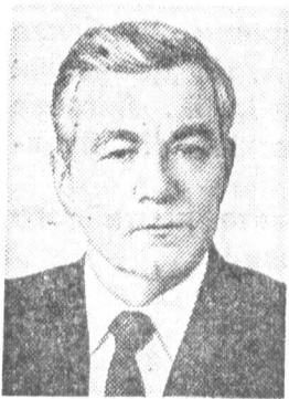
М. В. ЗИМЯНИН, секретарь ЦК КПСС