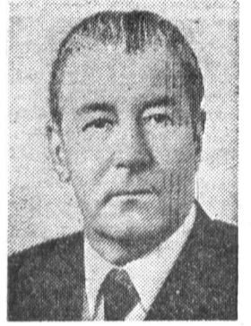
М. С. СОЛОМЕНЦЕВ, член Политбюро ЦК КПСС, Председатель КПК при ЦК КПСС