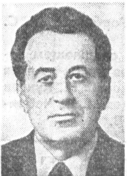
Г. П. РАЗУМОВСКИЙ, секретарь ЦК КПСС