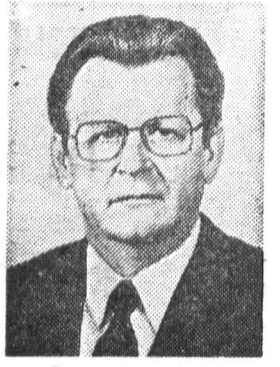
В. И. ВОРОТНИКОВ, член Политбюро ЦК КПСС