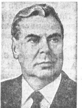
И. В. КАПИТОНОВ, Председатель Цент- ральной ревизионной комиссии КПСС