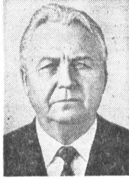
Е. К. ЛИГАЧЕВ, член Политбюро ЦК КПСС, секретарь ЦК КПСС