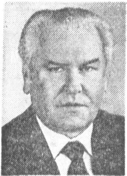
Н. Н. СЛЮНЬКОВ, кандидат в члены По- литбюро ЦК КПСС