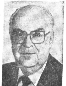
А. Ф. ДОБРЫНИН, секретарь ЦК КПСС