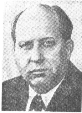
Н. В. ТАЛЫЗИН, кандидат в члены По- литбюро ЦК КПСС