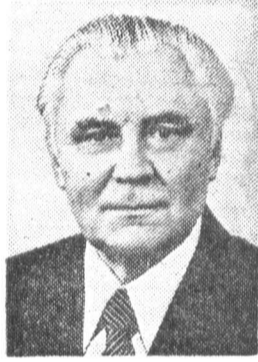
В. В. ЩЕРБИЦКИЙ, член Политбюро ЦК КПСС