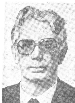
В. А. МЕДВЕДЕВ, секретарь ЦК КПСС