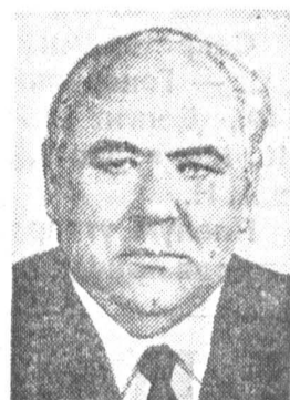
В. П. НИКОНОВ, секретарь ЦК КПСС