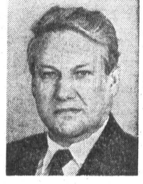
Б. Н. ЕЛЬЦИН, кандидат в члены По- литбюро ЦК КПСС