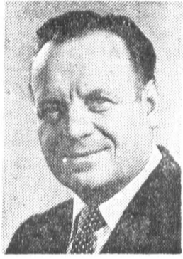
Л. Н. ЗАЙКОВ, член Политбюро ЦК КПСС, секретарь ЦК КПСС