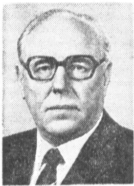
В. М. ЧЕБРИКОВ, член Политбюро ЦК КПСС