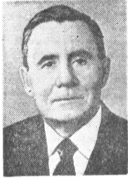
А. А. ГРОМЫКО, член Политбюро ЦК КПСС