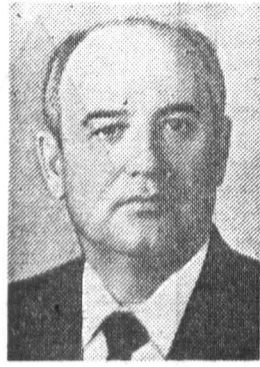
М. С. ГОРБАЧЕВ, член Политбюро ЦК КПСС, Генеральный сек- ретарь ЦК КПСС