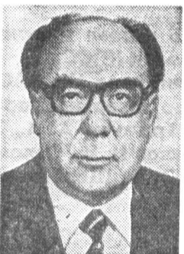
А. Н. ЯКОВЛЕВ, секретарь ЦК КПСС