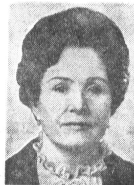
А. П. БИРЮКОВА, секретарь ЦК КПСС