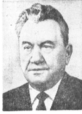
Д. А. КУНАЕВ, член Политбюро ЦК КПСС