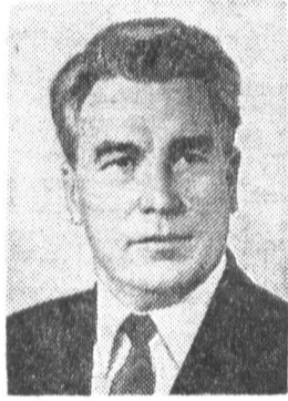
П. Н. ДЕМИЧЕВ, кандидат в члены По- литбюро ЦК КПСС