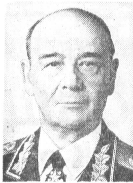
С. Л. СОКОЛОВ, кандидат в члены По- литбюро ЦК КПСС