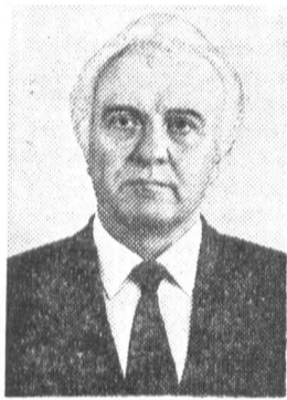
Э. А. ШЕВАРДНАДЗЕ, член Политбюро ЦК КПСС