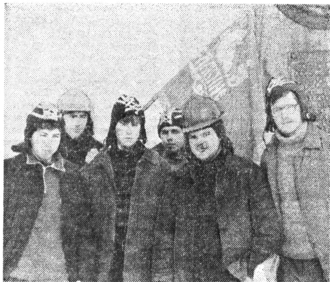
Бойцы студенческого строительного отряда «Славяне» у памятника погибшим воинам в деревне Гостилицы Ломоносовского района.