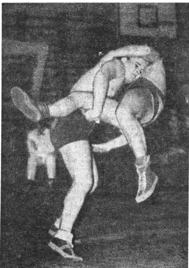
Тренировочные занятия в институтской секции вольной борьбы.