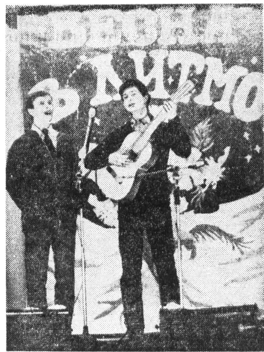
Своя гитара, своя мелодия, свои слова. На институтском конкурсном вечере.

В БИБЛИОТЕКУ института поступила следующая новая литература по технике: