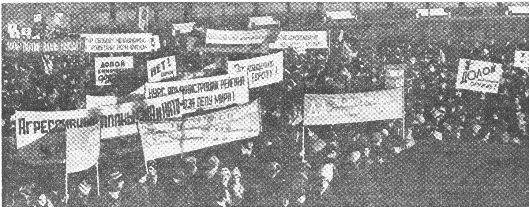
На антивоенной манифестации ленинградской молодежи.