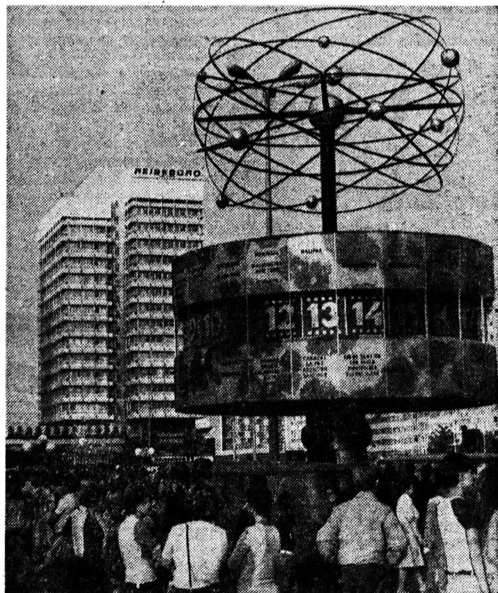
По маршрутам студенческих стройотрядов. ИССО «Товарищ» — в столице Германской Демократической Республики Берлине. Одна из достопримечательностей города — часы, показывающие время во всех часовых поясах планеты.