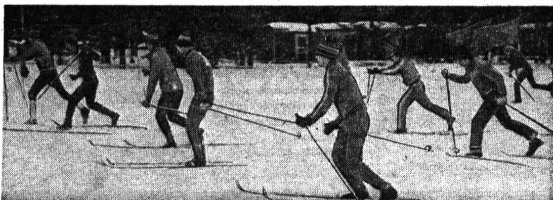
Фото студента ФЕДОРА БОГОРОДСКОГО

Последние дни дарит зима любителям лыжных гонок, зимних походов. В эти апрельские дни в пригородах Ленинграда состоятся заключительные старты лыжников.