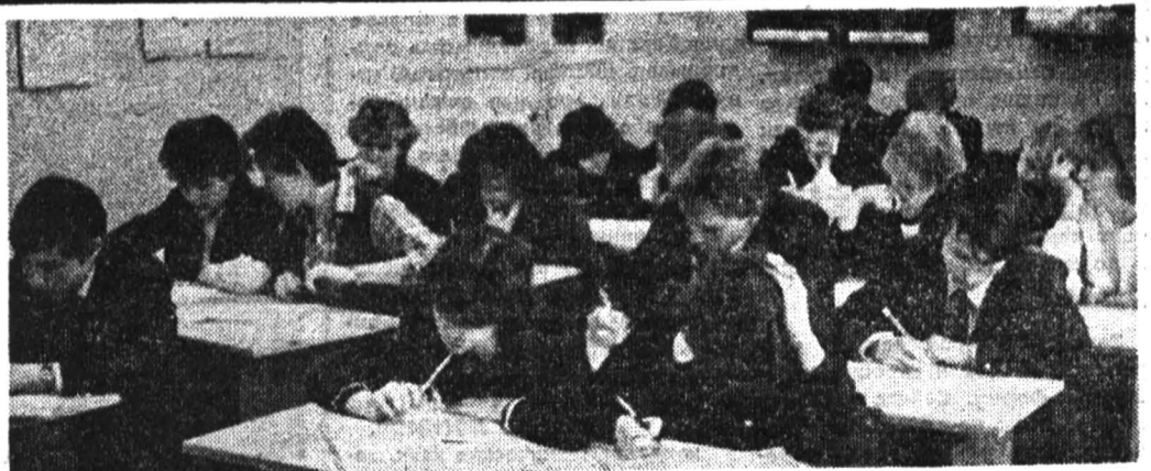
На финише сессия. Идут последние экзамены. Впереди каникулы.