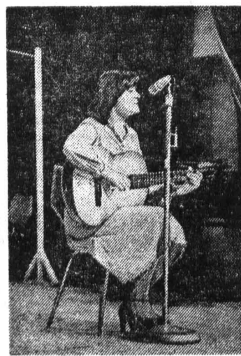
На вечер отдыха