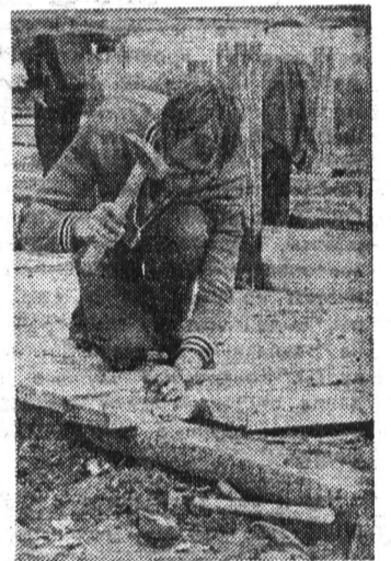
Из фотолетописи ССО. Ни герой, ни мореплаватель. Зато, возможно, академик, а сегодня — плотник.