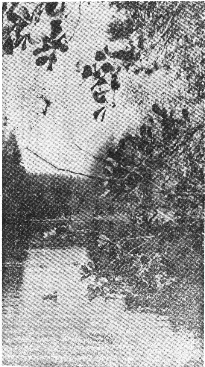
На озере Бересезом.