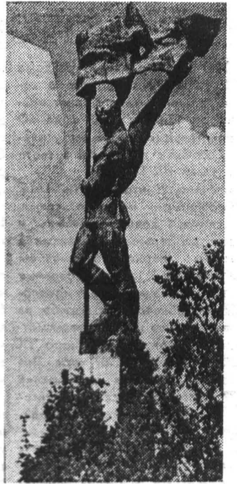
Ребята помогли мне сохранить о нем благодарную память. Сердечное им спасибо!