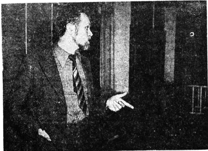
Новое в обучении