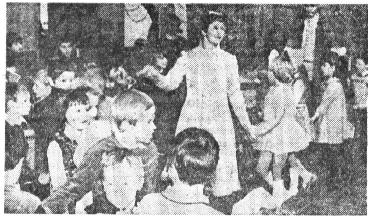
Праздник новогодней елки в детском доме Петроградского района.