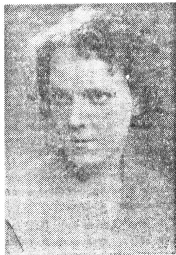
нашим общим домом.

И в нашем Ленинградском институте точной механики и оптики есть женсовет. Я лично мало сталкивалась с его деятельностью, но слышала от окружающих хорошие отзывы о его работе. Состав женсовета подобрался деловой. Я от души желаю всем членам женсовета крепкого здоровья и успехов во всех начинаниях, женского счастья и нежности, бодрости и энергии, стальных нервов и мирного неба над