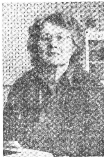
ваться такими же приветливыми и неунывающими.

Вообще о женщинах этого бюро мне говорили только хорошие: какие они отзывчивые, терпеливые и внимательные. Поздравляя их с праздником, мне хотелось бы пожелать им оста-