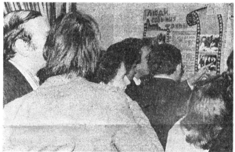
Вот так теперь везде: в лабораториях, на кафедрах, факультетах — всех интересуют только события, и только те, которые не являются исключением...