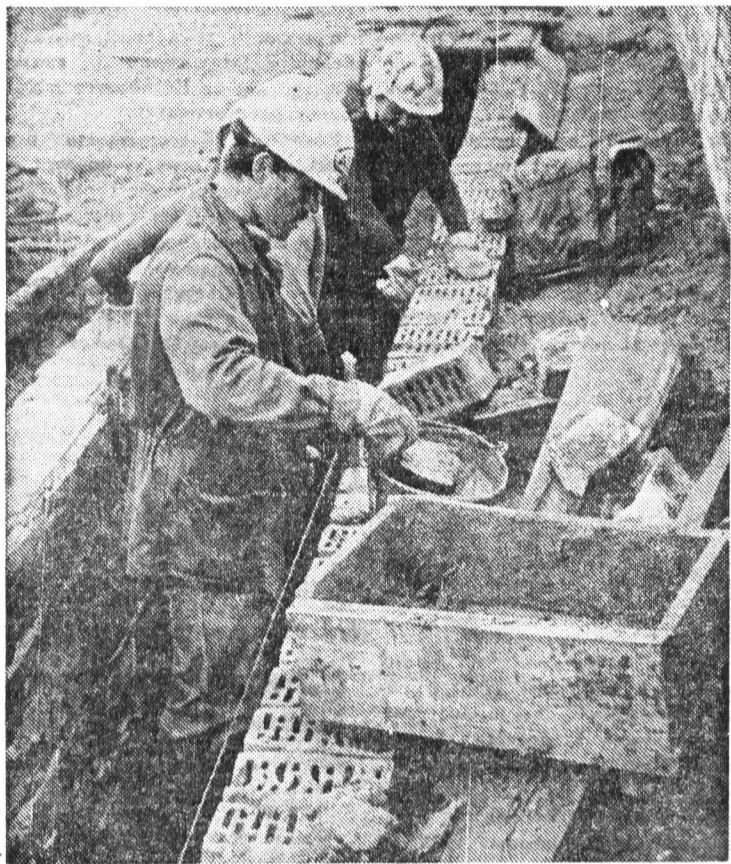
Конкурс каменщиков в ЗССО «Гатчинский».