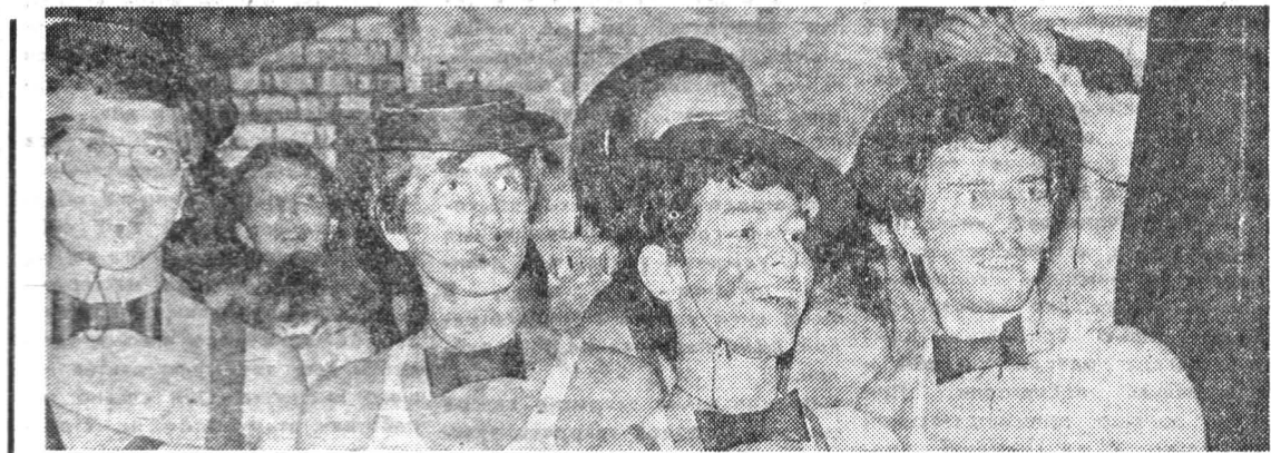
В каждом стройотряде складывается своя традиция веселых празднеств, сопровождающих начало и окончание трудового лета.

Контрольно-комбинированный маршрут, на котором участ-