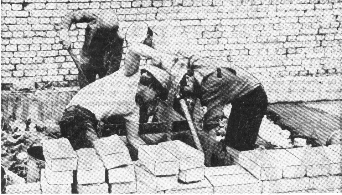
Бойцы интернационального отряда «Товарищ» готовят строительный раствор.

шо, и строители остались довольны нашей помощью. Вместе с нами работали наши друзья из Чехословацкой Социалистической Республики. В июле мы принимали студентов Высшей школы из города Кошице (ЧССР), а в августе — студентов университета из города Йена (ГДР).