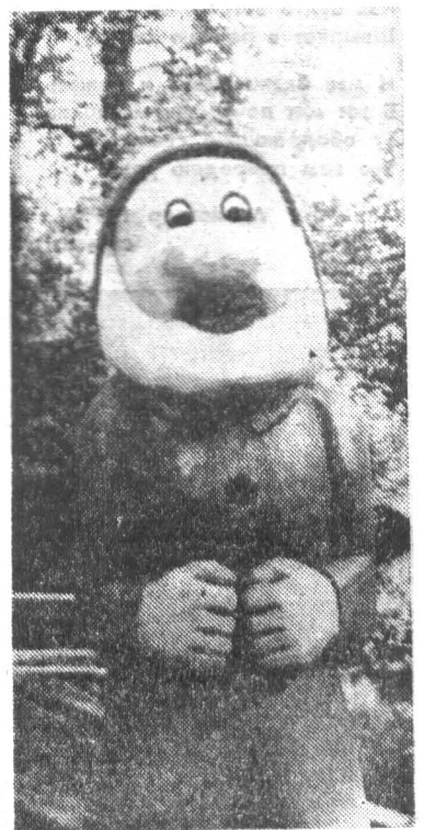
На игровой площадке на Каменном острове, построенной ССО «Гном».

Г. ВЫЖИМОВА, заведующая детским садом № 10