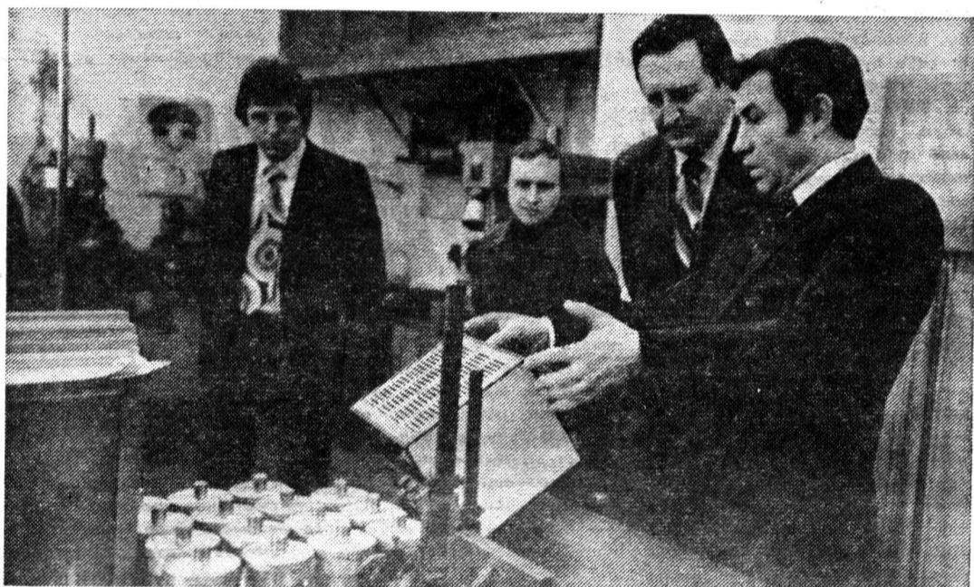
В связи с вручением экспериментально-опытному заводу ЛИТМО переходящего Красного знамени за победу во Всесоюзном социалистическом соревновании коллективов хозрасчетных предприятий и организаций Минвуза СССР с работой

На смотре-конкурсе лучших научно-технических разработок в ЛДНТП два экспоната ЛИТМО были отобраны на областную выставку «Достижения изобретателей и рационализаторов Ленинграда и области». Один из них — «Система дистанционного управления оптическим лучом ПУЛ-Н» в соответствии с решением Госкомитета СССР по науке и технике и ЦС ВОИР рекомендован к экспонированию в 1984 году на выставке в городе Хошимине (СРВ). Г. ПЕТУХОВА, инженер патентного отдела