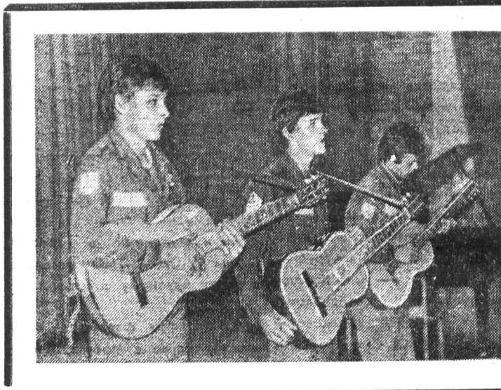
Выступает агитбригада строящегося «Непогоджащихся».

Содействовать выработке высокой политической культуры у каждого нашего комсомольца — важнейшая задача и кафедр общественных наук, и партийной организации института, и коми-