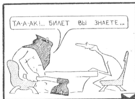
Рис. студента Гали Миргасима