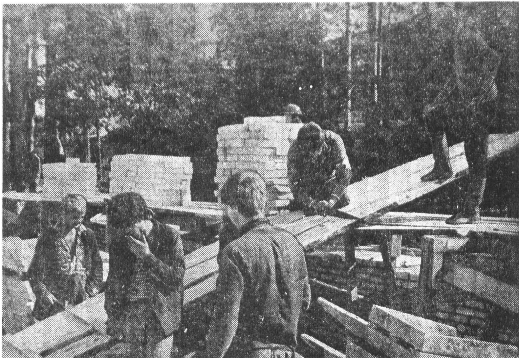
Во время трудового семестра в Гатчинском районе проводились конкурсы профессионального мастерства. Особенно успешно справились с конкурсными заданиями плотники ССО «Славяне».