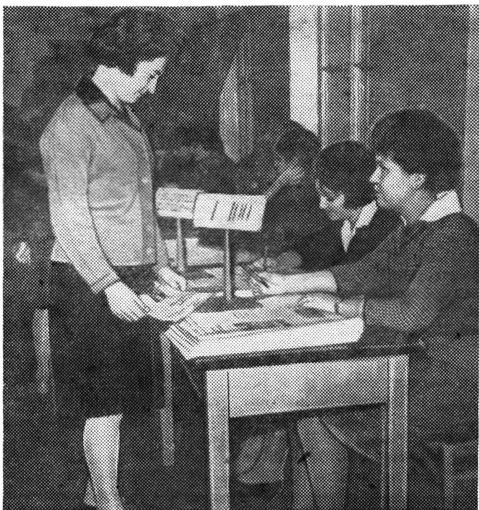
Идёт регистрация делегатов...

Типография им. Володарского Лениздата, Ленинград, Фонтанка, 57.