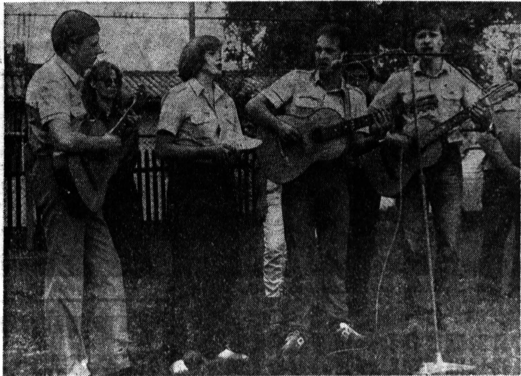
Антивоенный митинг солидарности в интернациональном студенческом лагере в Плотине (ГДР). Выступают бойцы ИССО «Товарищ»