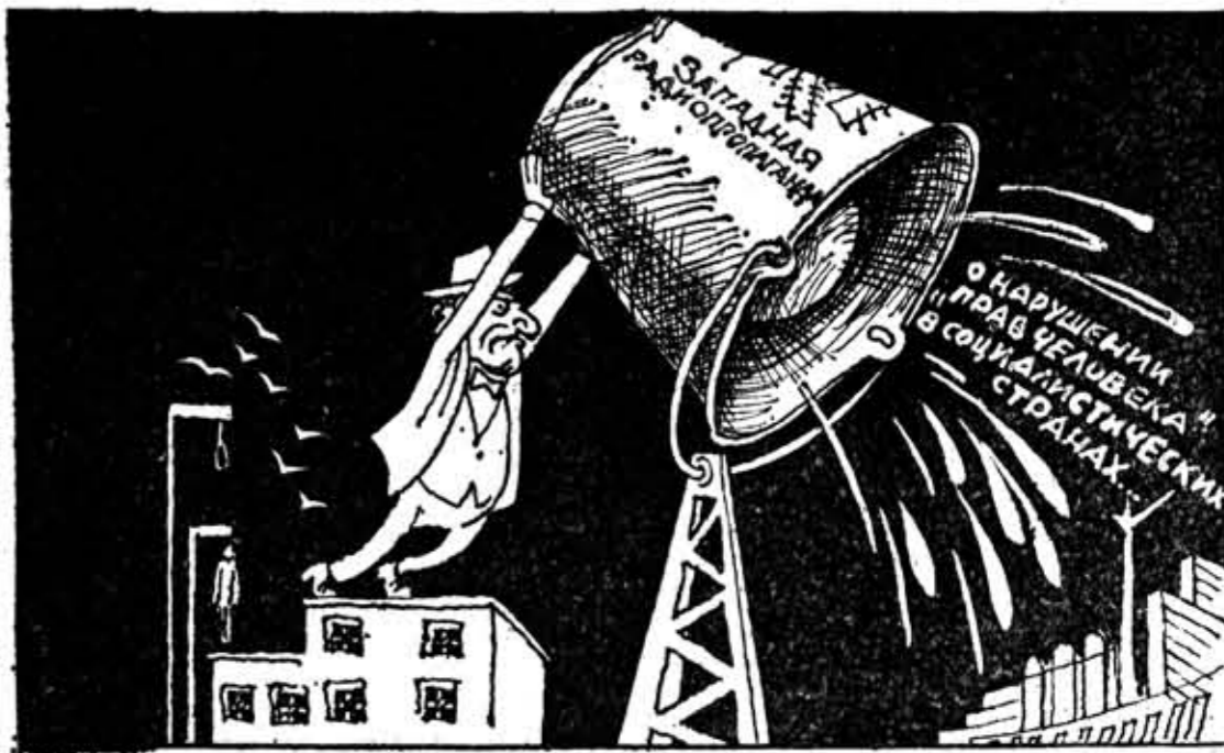
Как из ведра.

Социалистическая концепция прав человека, основанная на марксистско-ленинском учении, открывает перед советскими гражданами широкий простор для проявления всех своих способностей. Конституция СССР предоставляет им такой комплекс прав и свобод, который охватывает все сферы экономической, политической, социальной и духовной жизни. Характерной особенностью общества развитого социализма является не только дальнейшее расширение прав советских людей, но и выполнение их новым реальным содержанием. Декларировать и записать на бумаге можно все, что угодно. Но одно дело — провозгласить то или иное право и, соответственно, ту или иную свободу на пользование