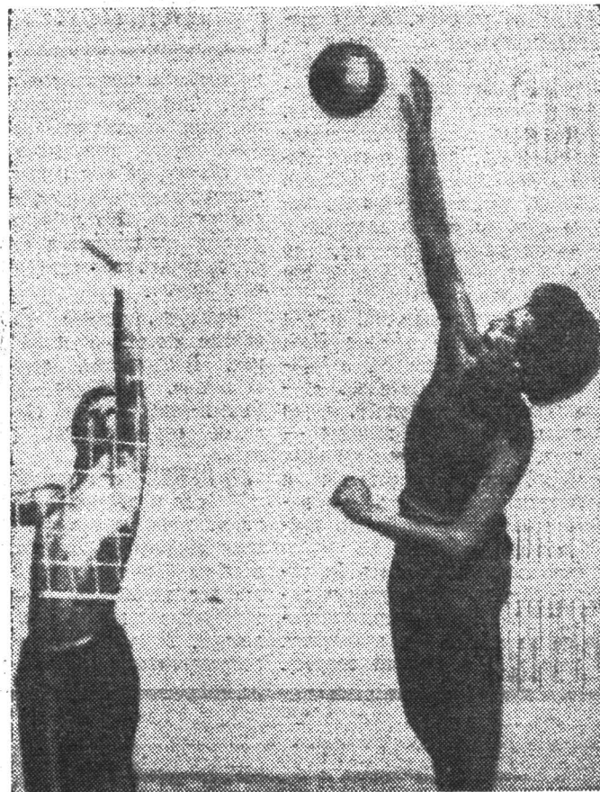
Из фотолетописи ССО. Волейбольный турнир в Набережных Челнах.

Газоструйно-лазерный процесс предусматривает несколько вариантов «содружества» светового и воздушного потоков. Они могут не только мчаться навстречу друг другу, но и действовать параллельно, встречаться под прямым углом. Оптимальный вариант выбирается в зависимости от технологической задачи.