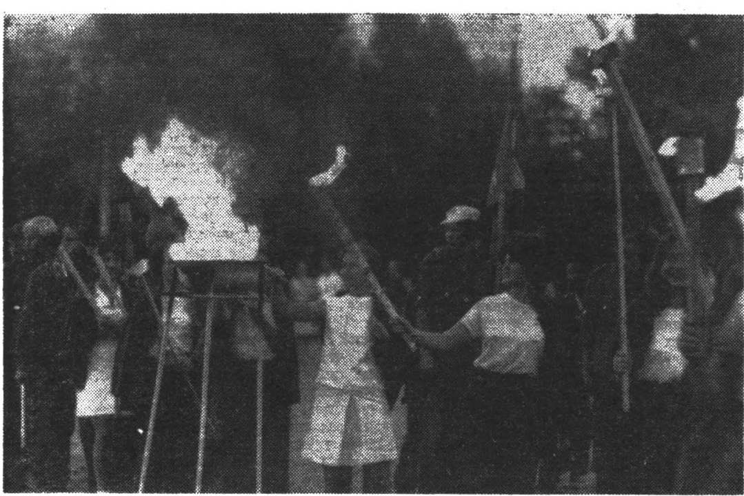
Хорошей комсомольской традицией стало проведение праздников интернациональной солидарности. На снимке: студенты нашего института, выезжавшие в составе интернационального строительного отряда «Товарищ» в Ставропольский край, на празднике Дружбы.