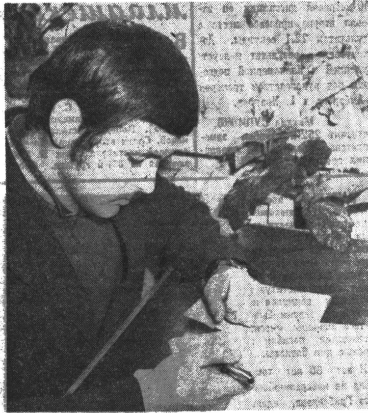
проектируемого устройства и отказать от принятых решений во имя более лучших. И так до студентов общежития обсуждалась справедливость такого утверждения для конструирования и

го образца устройства вызывают исключительно положительные эмоции. А вот стирание неверных решений и ношение чертежей в институт и обратно, как правило, связано с появлением отрицательных эмоций.