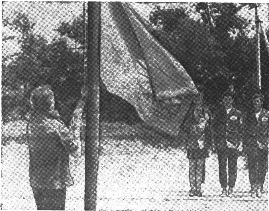
КРЕПКАЯ ДРУЖБА СВЯЗАЛА БОЙЦОВ ИНТЕРНАЦИОНАЛЬНОГО ССО «ТОВАРИЩ», ВЫЕЗЖАВШЕГО ПРОШЛЫМ ЛЕТОМ В СТАВРОПОЛЬСКИЙ КРАЙ.

ЗНАЧИТЕЛЬНЫЙ подъем молодежного движения протеста в странах капитализма, наметившийся в начале 60-х годов и достигший своего апогея в 1968 году, вызвал пристальное внимание во всем мире. Этот естественный интерес к проблемам молодежи был немедленно использован буржуазной пропагандой. Огненно-рыжий студент из Сорбонны Даниэль Кон-Бендин, призывавший «бить парней из коммунистической партии», или яростный главарь леваков в ФРГ Руди Дучке стали суперзвездами рекламного небосвода, а пресловутая книга «Друга молодежи» Герберта Маркузе «Одномерный человек», противопоставляющая капиталистическую стереотипизацию человеческого сознания штампы псевдореволюции без рабочего класса, стала бестселлером.