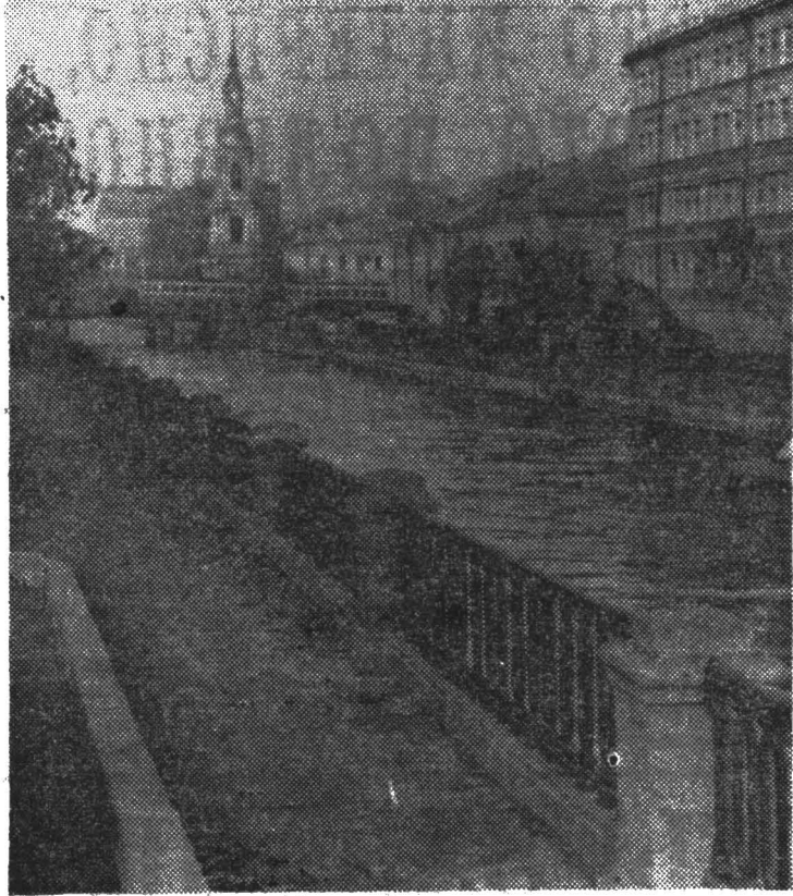
Из осенних фотозюдов наших читателей. На Крюковом канале.