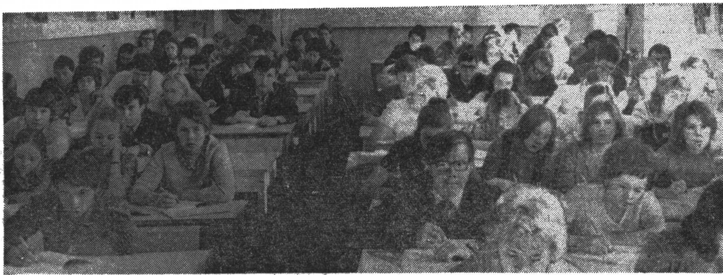
Второкурсники факультета оптико-механического приборостроения на лекции по математике.