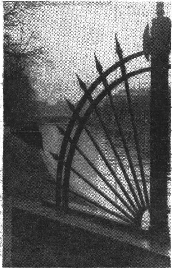
Наш город. Набережная Мойки.

ва. Вы найдете на ее страницах привычные рубрики: «Вопросы теории», «За стиркой решений XXIV съезда КПСС», «Наука управлять», «Рождено соревнованием» и другие, а также новые разделы по проблемам экономического и культурного строительства, социального развития нашего общества, коммунистического воспитания трудящихся, торговли и бытового обслуживания населения.