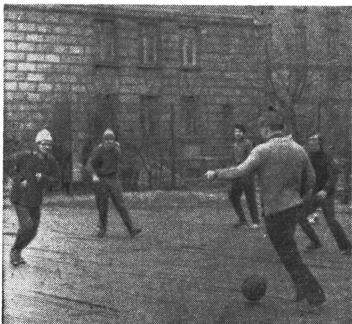
На спортивной площадке у институтского общежития.