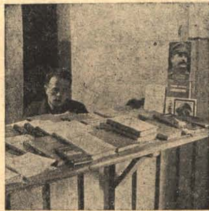
Снова работает книжный киоск.