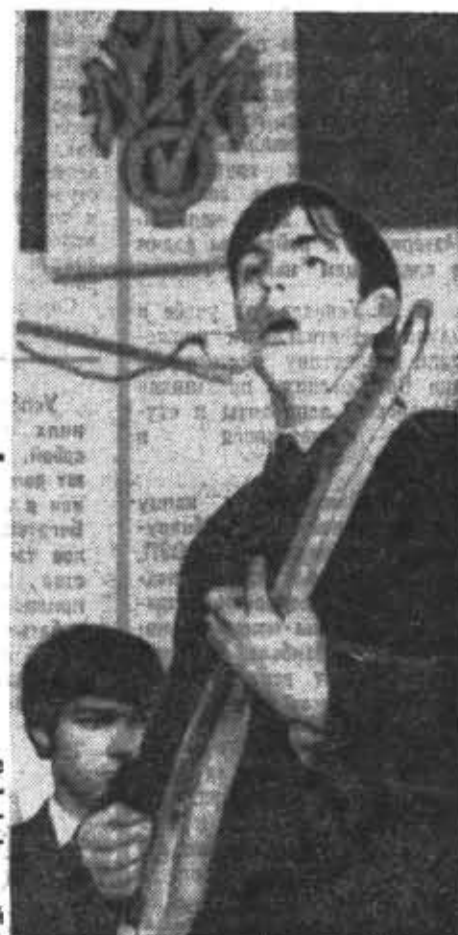
На конкурсной вечере студенты получили возможность познакомиться со многими интересными исполнителями.