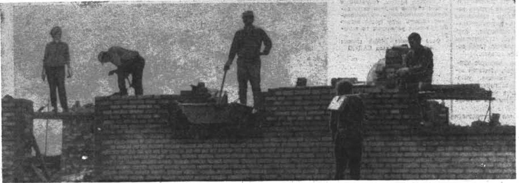
ИЗ ФОТОЛЕТОПИСИ ТРЕТЬЕГО СЕМЕСТРА РАБОЧЕЕ УТРО В ОТРЯДЕ «НЕПОДАЮЩИЕСЯ».

● ● Дружно, с подъемом направлялись на праздничную демонстрацию студенты и преподаватели института. Несмотря на плохую погоду, отлично проявил себя духовой оркестр, руководимый студентом 448-й группы А. Грозным, а это способствовало созданию праздничного настроения. Следует отметить также художников-оформителей, которые за короткий срок подготовили плакаты и лозунги для колонны института. ● ● Предпраздничными и воскресными встретили 7 ноября комсомольцы института. Особенно отличились студенты факультета оптико-