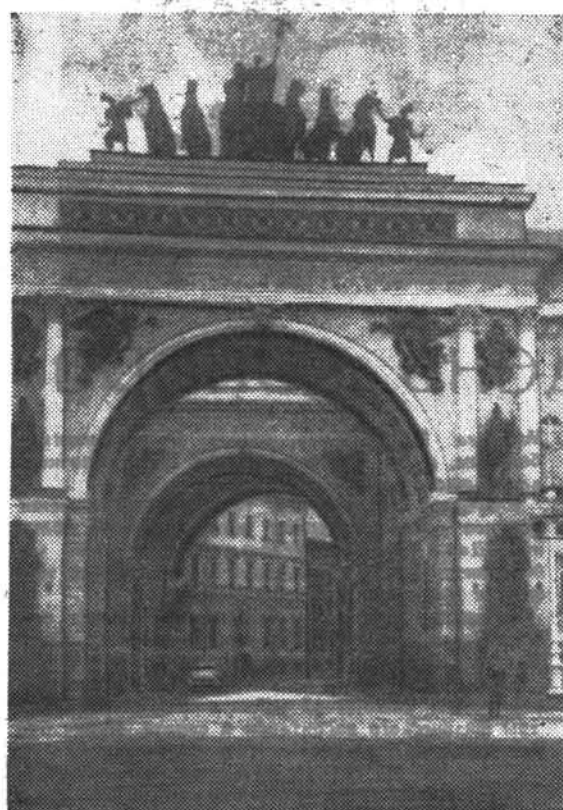
Наш город. Арка Главного штаба.

Мы НЕ СТАВИЛИ своей целью назвать в этой статье конкретных нарушителей военно-учетной дисциплины из числа студентов и сотрудников института. Нам лишь хочется подчеркнуть,