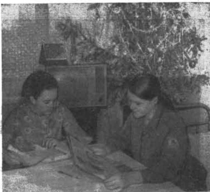
Невелика елка, зато насколько уютнее стало в комнате общежития.