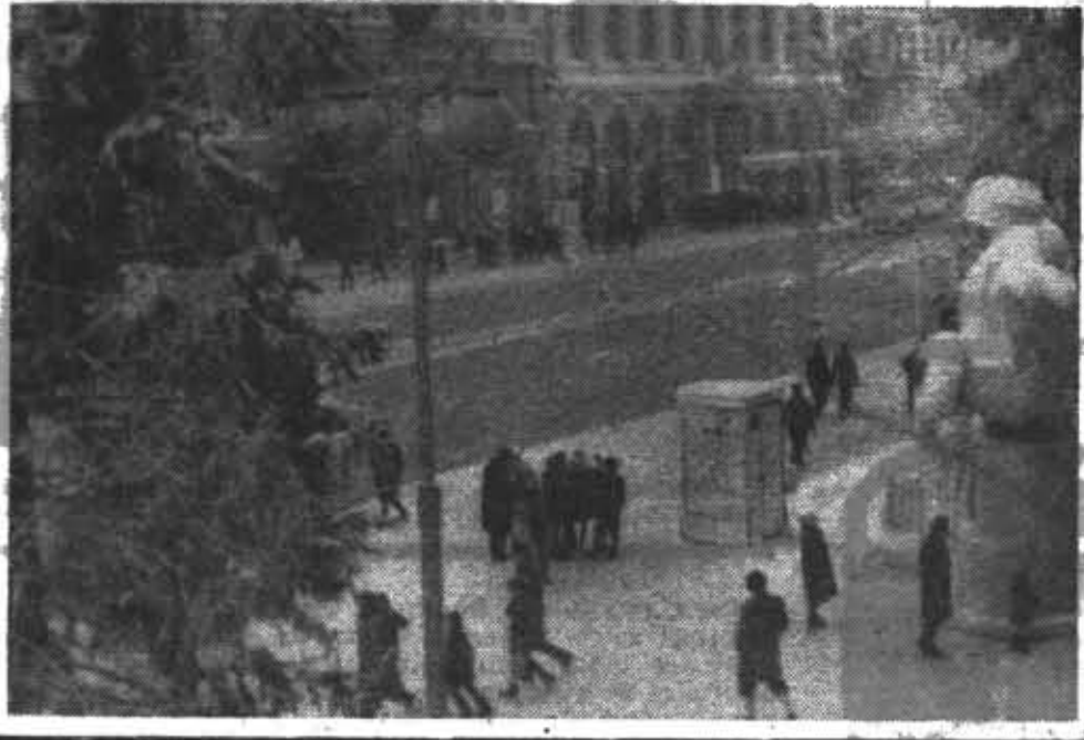
ЛЕНИНГРАД ПРЯМОУГОДНИК.

50 билетов — на новогодние балы для старшеклассников.