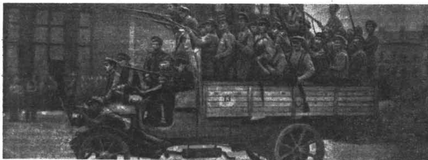
1918 год. Один из первых отрядов Красной Армии, созданный в Петрограде.

КАК Я СТАЛ профессиональным военным? Что привлекает в военной службе? Доволен ли я своей судьбой? Примерно такие вопросы часто приходится слышать от молодых людей, вступающих в самостоятельную жизнь и желающих найти свое место в ней.