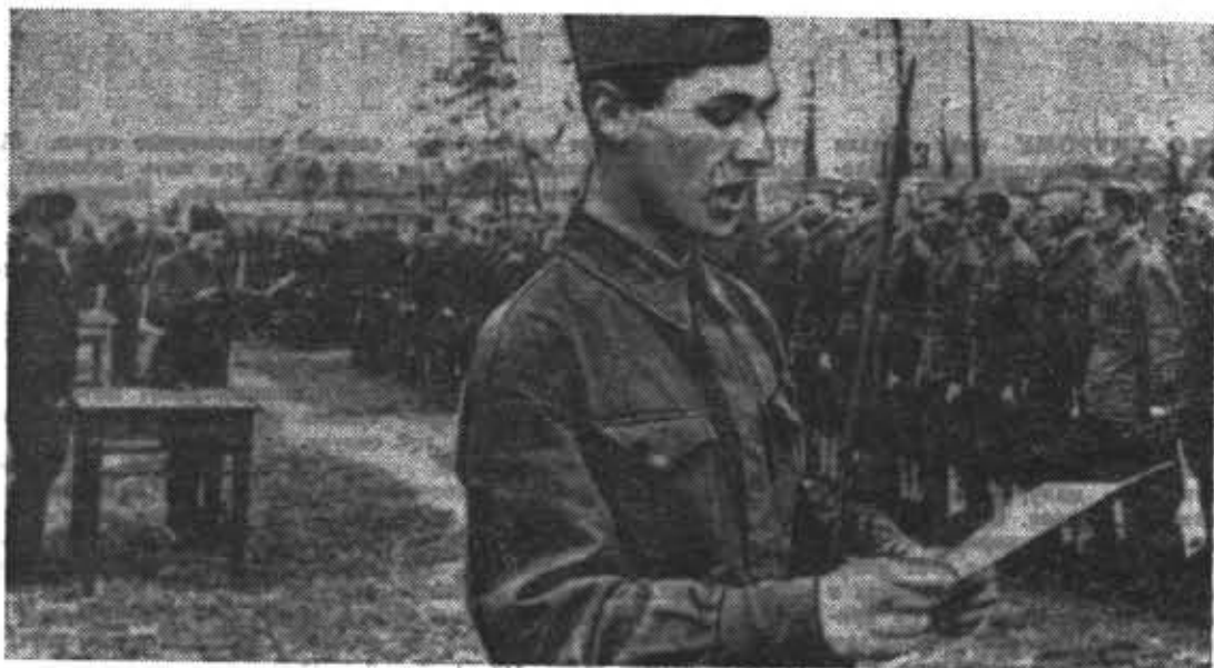
1941 год. Принятие присяги советскими воинами.